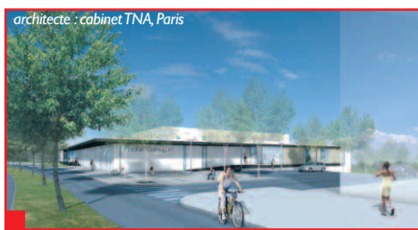
Reconstruction de la piscine Gernugan.